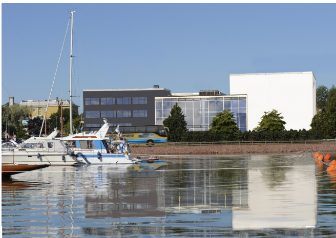
Alandica konferens där energidagen hålls

för att få uppslag till vad man kan göra under veckändan.